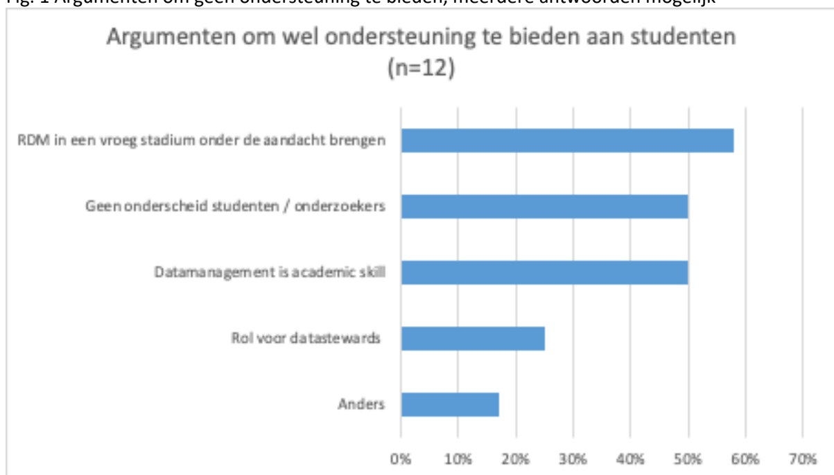
Fig. 1 Argumenten om wel ondersteuning te bieden, meerdere antwoorden mogelijk